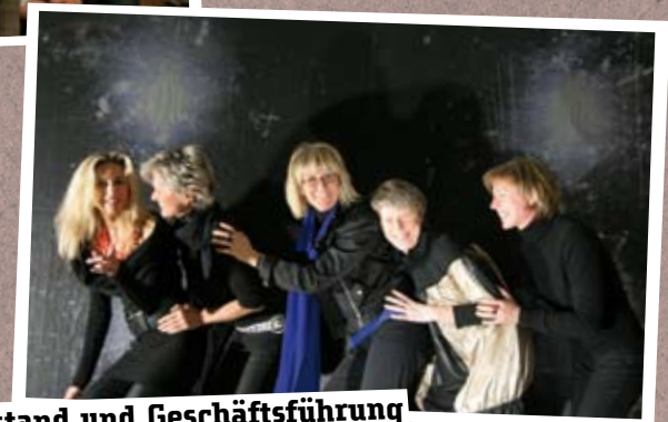
Vorstand und Geschäftsführung Verein Stuttgarter Kriminächte e.V.